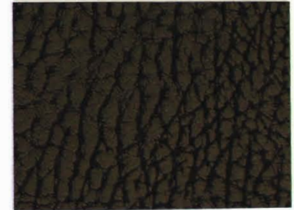
504 x 4597