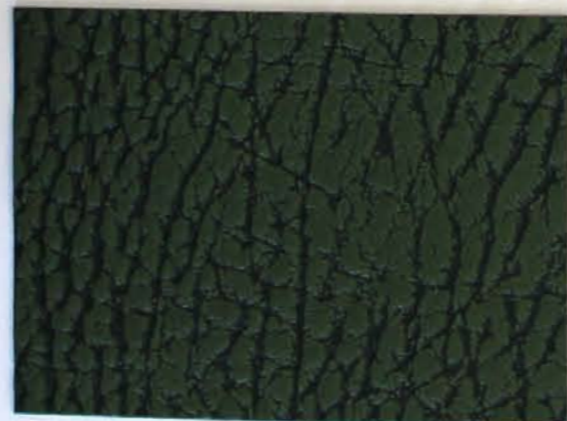
504 x 4592