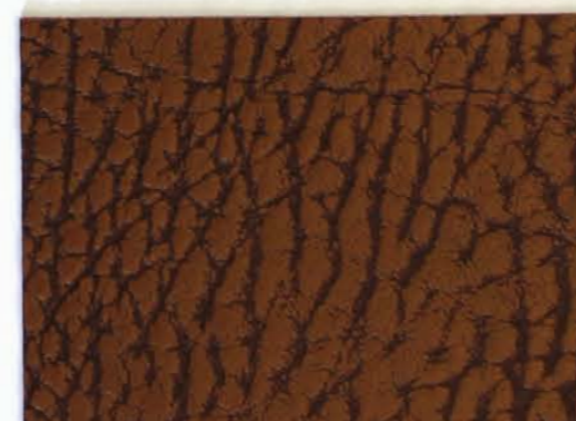
504 x 4595