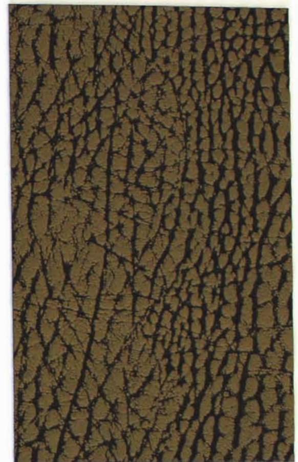
504 x 4596