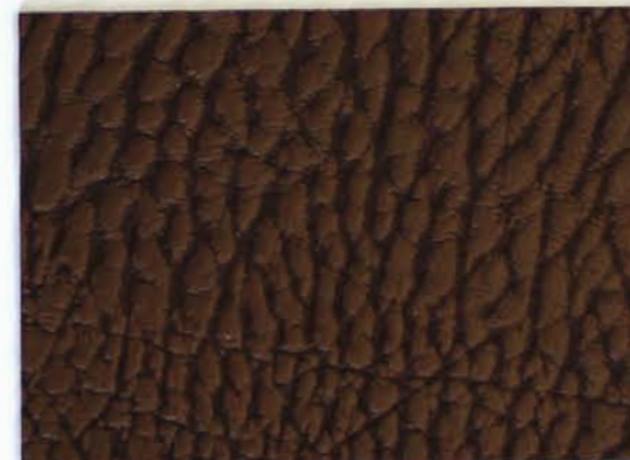
504 x 4594