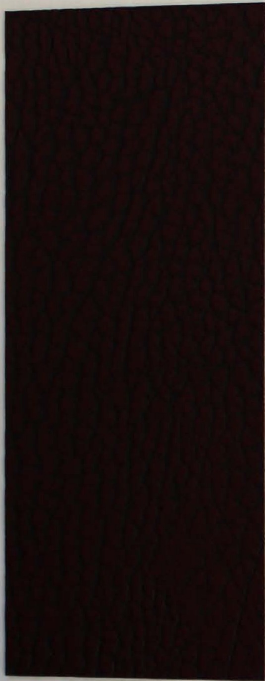
504 x 4590