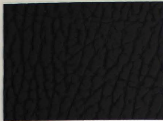
504 x 4591