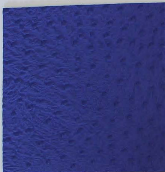
332 x 3278 Standard-Rücken / standard backing

Artikel teilweise in 2 Qualitäten erhältlich, mit Fleece-Rücken oder dehnbarem Mischgewebe. Article partly available in 2 qualities, with fleece backing or with stretchable blended fabric.