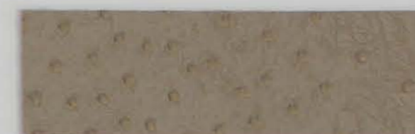
332 x 2807 Standard-Rücken / standard backing