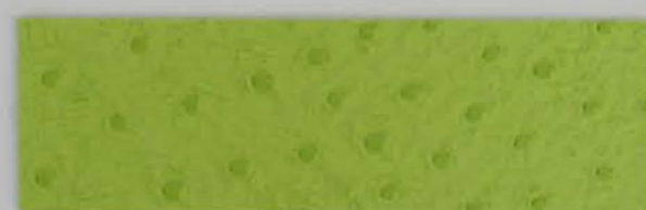
332 x 3977 Standard-Rücken / standard backing