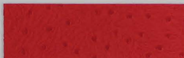
332 x 2815 Standard-Rücken / standard backing