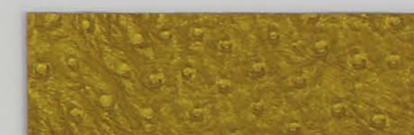
532 x 3283 Fleece-Rücken / fleece backing