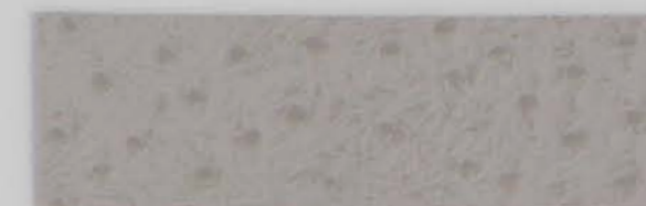
332 x 3974 Standard-Rücken / standard backing