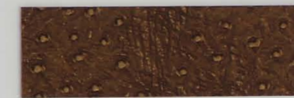
332 x 3282 Standard-Rücken / standard backing