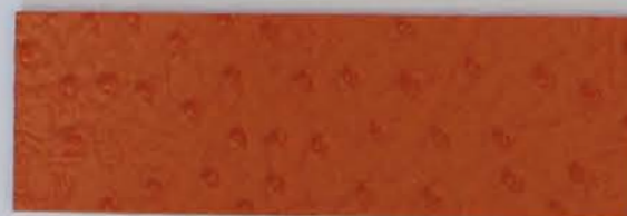
332 x 2805 Standard-Rücken / standard backing 532 x 2805 Fleece-Rücken / fleece backing