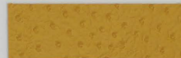
332 x 3978 Standard-Rücken / standard backing