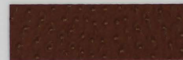
332 x 2806 Standard-Rücken / standard backing 532 x 2806 Fleece-Rücken / fleece backing