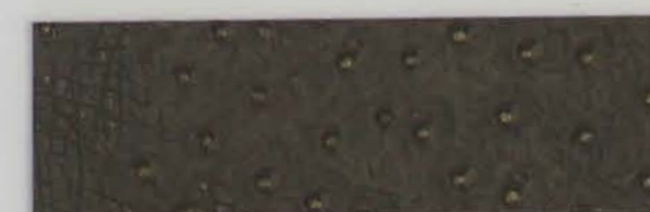
332 x 3976 Standard-Rücken / standard backing