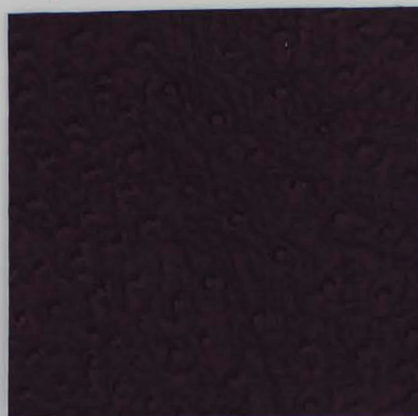
532 x 3280 Fleece-Rücken / fleece backing