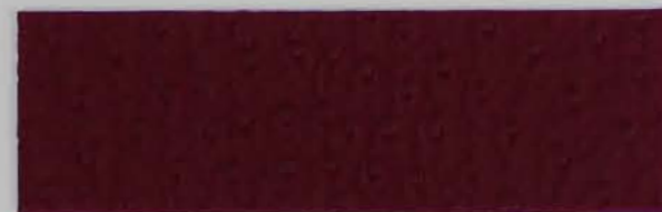
332 x 3279 Standard-Rücken / standard backing 532 x 3279 Fleece-Rücken / fleece backing