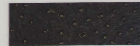
332 x 3975 Standard-Rücken / standard backing