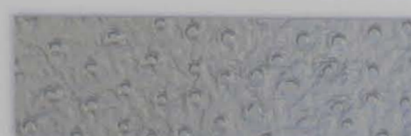
532 x 3281 Fleece-Rücken / fleece backing