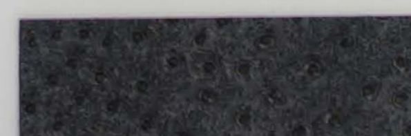
332 x 2813 Standard-Rücken / standard backing 532 x 2813 Fleece-Rücken / fleece backing