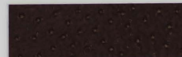
332 x 2808 Standard-Rücken / standard backing 532 x 2808 Fleece-Rücken / fleece backing