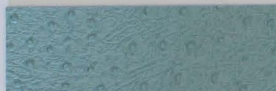
532 x 2810 Fleece-Rücken / fleece backing