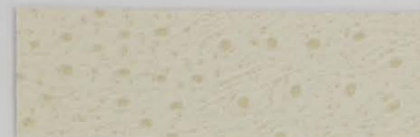
332 x 2816 Standard-Rücken / standard backing