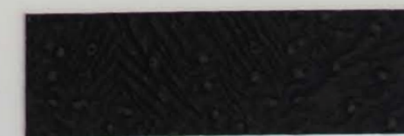
332 x 2814 Standard-Rücken / standard backing 532 x 2814 Fleece-Rücken / fleece backing