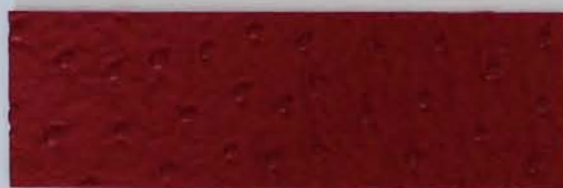
332 x 3292 Standard-Rücken / standard backing