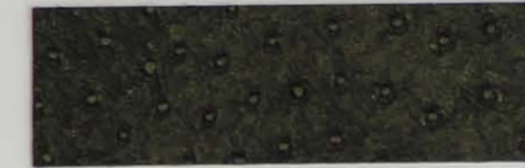
332 x 2800 Standard-Rücken / standard backing 532 x 2800 Fleece-Rücken / fleece backing