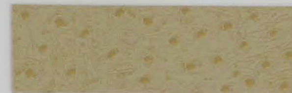
332 x 2809 Standard-Rücken / standard backing 532 x 2809 Fleece-Rücken / fleece backing