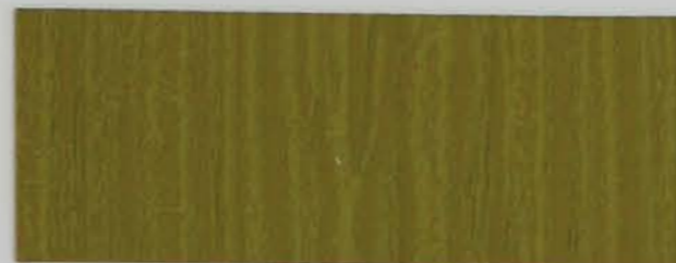
222 x 2956