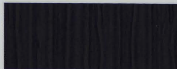
222 x 2963