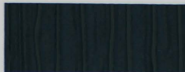
222 x 2957