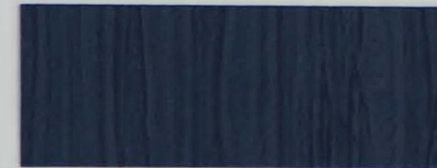
222 x 2961