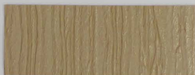
222 x 2951