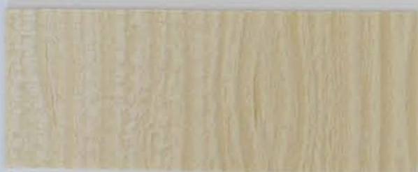
222 x 2950