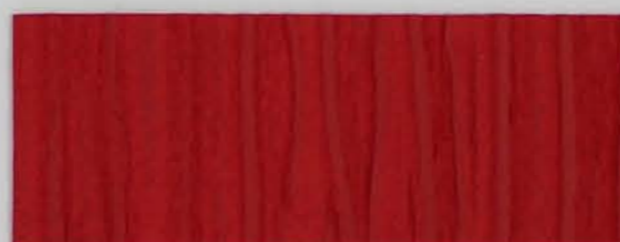
222 x 2966