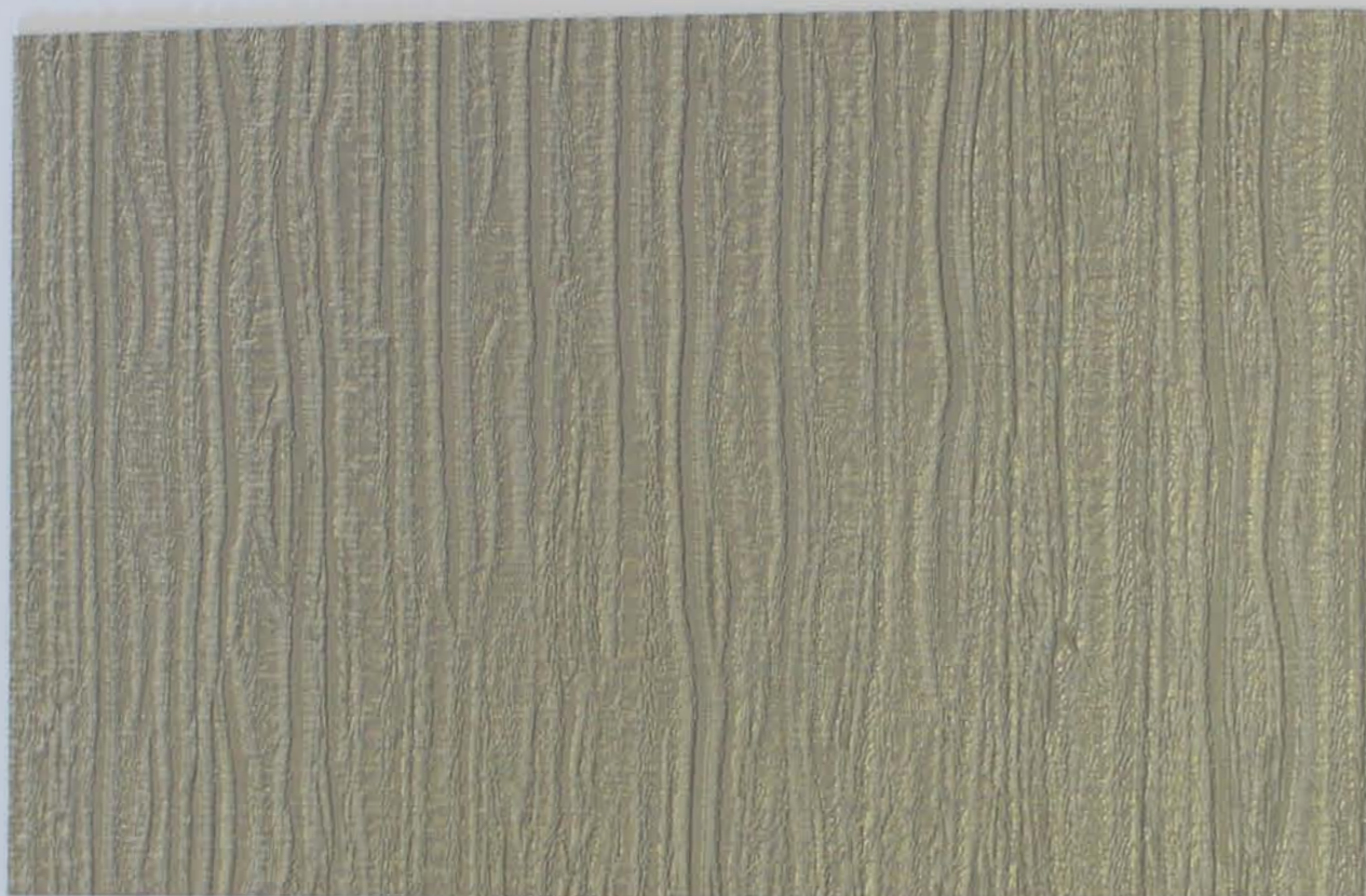
223 x 3675