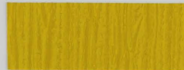
222 x 2968