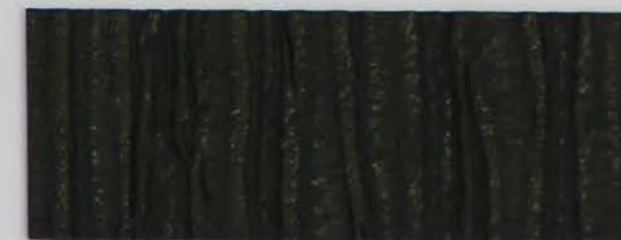
223 x 2983