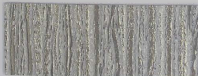
223 x 2971