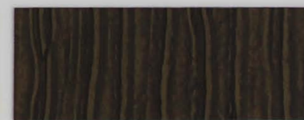
222 x 2955