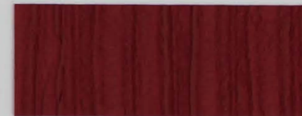
222 x 2965