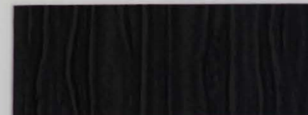
222 x 2967