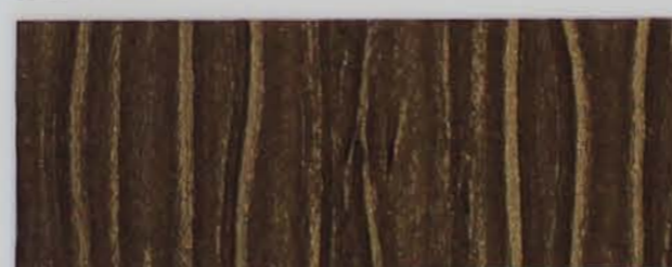
223 x 2969