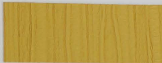
222 x 3676