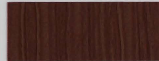
222 x 2953