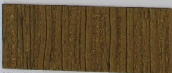
223 x 2970